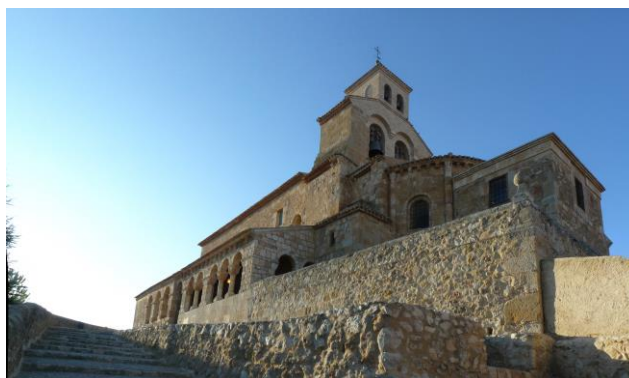
Iglesia románica de Nuestra Señora del Rivero (San Esteban de Gormaz)