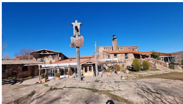
Restaurante “La Venta de Tiermes”

Parada para desayunar - Hotel Langa - (Cerezo de Abajo), km 101 de la A1)