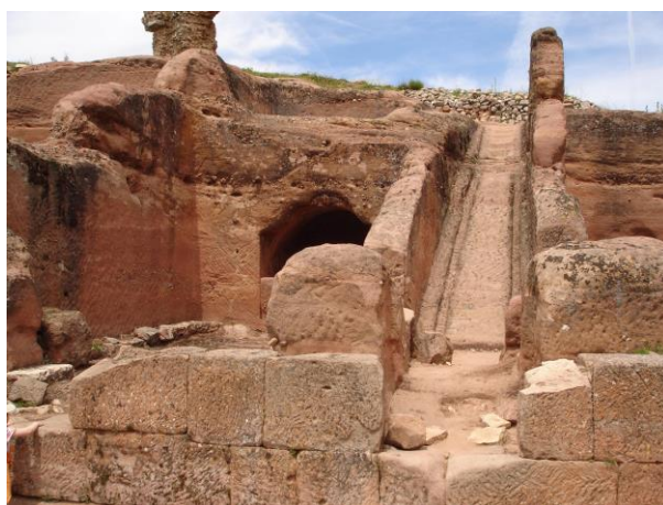
Yacimientos celtiberos en Tiermes